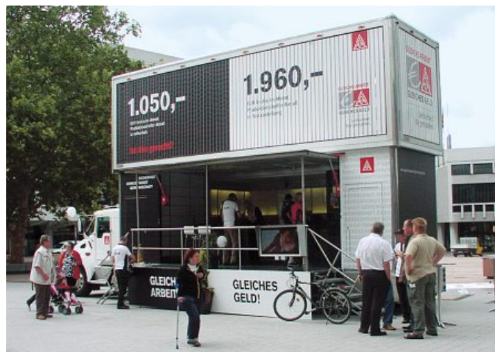
Aktionstruck in der Pforzheimer Innenstadt

Den guten tariflichen Regelungen und Betriebsvereinbarungen wie sie auch im Enzkreis bei Behr, Doduco, und Scheffel abgeschlossen wurden und bei Rau und Inovan derzeit verhandelt werden, müssen jetzt verbindliche gesetzliche Regelungen folgen. Die Politik