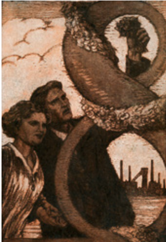
Postkarte zum Gewerkschaftsfest, Leipzig 1919

Aus Anlass des 100-jährigen Jubiläums der Novemberrevolution veranstalten Hans-Böckler-Stiftung, Friedrich-Ebert-Stiftung und die Stiftung Geschichte des Ruhrgebiets eine Konferenz, in der sie nach der Rolle der Gewerkschaften in Europa am Ende des Ersten Weltkriegs fragen. Wir wollen uns mit den damaligen Herausforderungen, wegweisenden Neuerungen, aber auch mit Widersprüchen auseinandersetzen, die sich unter gewandelten Rahmenbedingungen heute neu stellen. Eine Stärkung der politischen und sozialen Demokratie in Deutschland und in Europa kann nur mit einer Kultur der Erinnerung gelingen, die um die Widersprüche auf dem Weg in die Gegenwart und die Offenheit der Zukunft weiß.