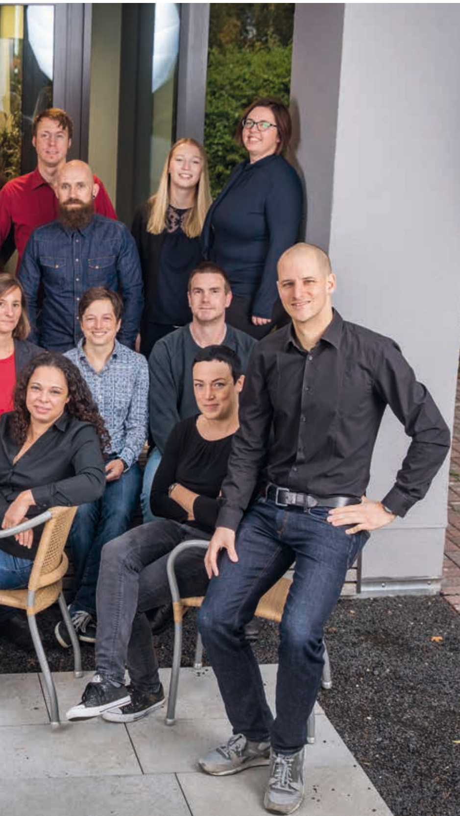
Das Team des Gemeinsamen Erschließungs- projekts (GEP) des IG Metall Bezirks Baden-Württemberg im Oktober 2017